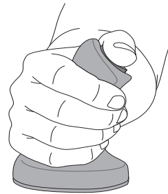
Goede neutrale stand van de pols