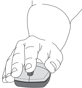
Slechte stand van de pols

Hartelijk dank voor het aanschaffen van de EM550 ergonomische muis van 3M™. Uit klinisch onderzoek is gebleken dat deze draadloze optische muis minder pijn en ongemak in hand, pols en arm veroorzaakt dan een gewone muis.* De gepatenteerde verticale handgreep zorgt dat uw hand en pols in een natuurlijke stand blijven staan.